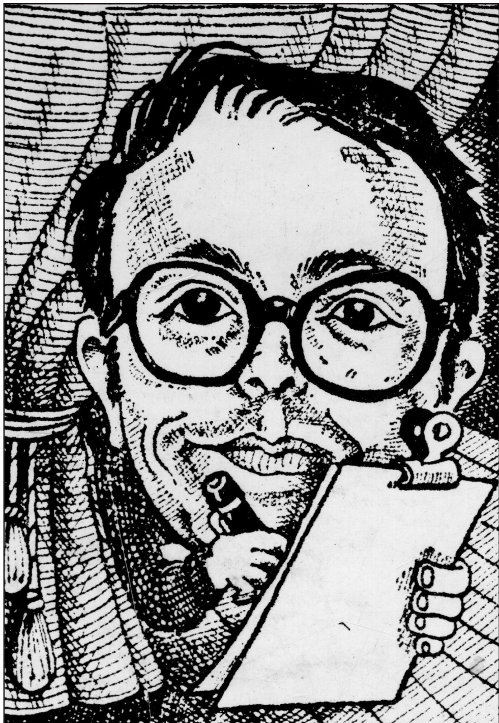
(σκίτσο του Γιάννη Ξανθούλη από τον Διογένη Καμμένο)