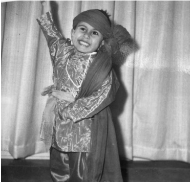
Γεμάτος ενθουσιασμό σε ηλικία τεσσάρων ετών.

Μεγάλωσα σε μια εργατική κωμόπολη πέντε χιλιάδων κατοίκων, σε ένα μικρό σπίτι κοντά στη θάλασσα. Είμαι παιδί μεταναστών με πολύ καλή καρδιά και σίγουρα δεν έτρωγα με χρυσά κουτάλια.