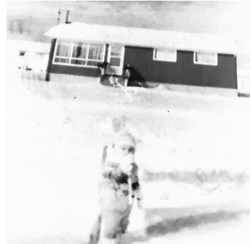
Παίζοντας με το χιόνι μπροστά στο σπίτι μου.

Ναι, εγώ είμαι σε ένα θεατρικό του σχολείου. Και στην αυλή του σπιτιού μας έναν πολύ κρύο χειμώνα. Όπως βλέπετε, δεν υπάρχει καμία Ferrari παρκαρισμένη μπροστά. Κανένα λαμπερό στολίδι ή περιττή διακόσμηση. Τα πολύ βασικά. Ο καλύτερος τρόπος ζωής.